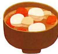
すいとん風 貝だくさんみそ汁