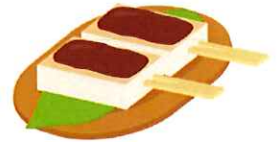
いも田楽のくるみ味噌がけ